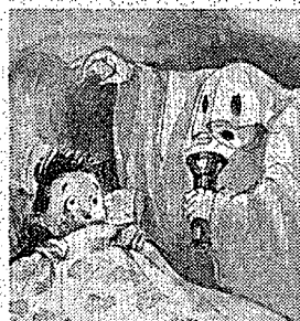
Jetons l'air de dire pour à son frère.

On pourrait bien objecter que le recours à l'illustration n'est valable que dans les cas de concepts exocentriques, dont la définition met « forcément » en jeu l'expérience sensorielle ; cependant, un usage avisé de l'illustration peut rendre cette pratique performante même dans le cas de concepts relationnels plus complexes, qui ne se définissent d'habitude que par le renvoi à d'autres unités lexicales ; nous citerons à ce propos l'exemple du substantif abstrait peur dans le Robert Benjamin : dans ce cas, la définition linguistique (« la peur, c'est l'émotion très forte que l'on ressent lorsque l'on est en face d'un danger ») est accompagnée d'une illustration qui met en scène une situation de peur typique de l'univers des enfants.